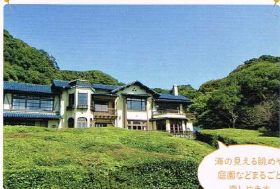
海の見える眺めや 庭園などまるごと 楽しめます

■休館日:11月は13日(月)のみ休館。通常月曜日(祝日開館)、展示替期間・特別整理期間など、年末年始(12/29~1/3) ※5・6月、10・11月は1回の休館日を除き開館。