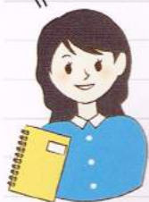
和風が好み♪ 編集:U奈