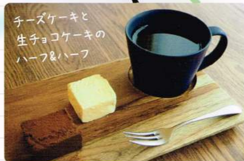
チーズケーキと生チョコケーキのハーフ&ハーフ

鎌倉市長谷1-11-35 ■TEL:0467-84-7058 ■営業時間:13:00~19:00 (LO 18:00) ■定休日:月~金曜日、祝日は不定休 ※撮影、SNSへの写真掲載はお断りしています。小学生以下、ペットは入店できません。