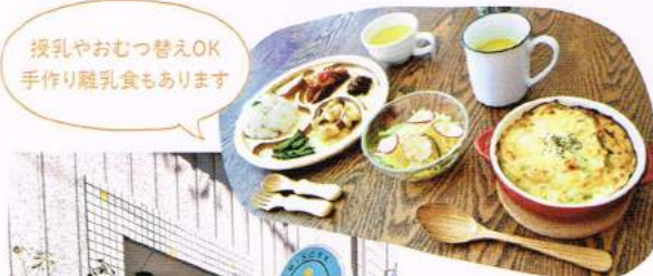
授乳やおむつ替えOK 手作り離乳食もあります