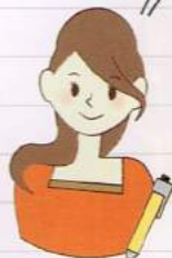
甘いもの大好き! 編集:E子