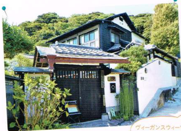
ヴィーガンスイーツは 奥様の手作り